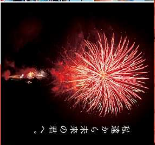
私達から未来の君へ。